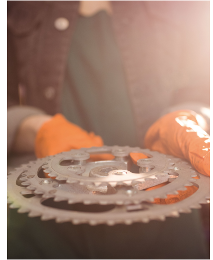
Elaboracion de Repuestos

Materiales, insumos y componentes a faenas mineras, obras y plantas, con protocolos de estos sectores.