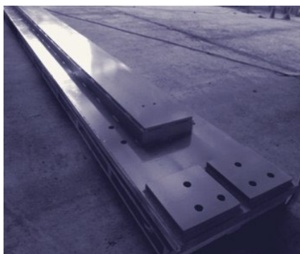
RIELES DE FILTRO LASTA