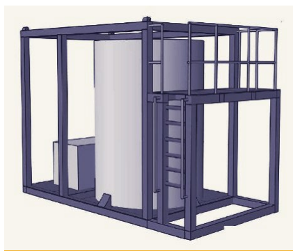
INGENIERÍA Y DISEÑO 3D