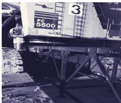
ESTRUCTURA CAMBIO CORONA