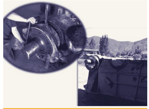
REPARACIÓN DE CHANCADOR