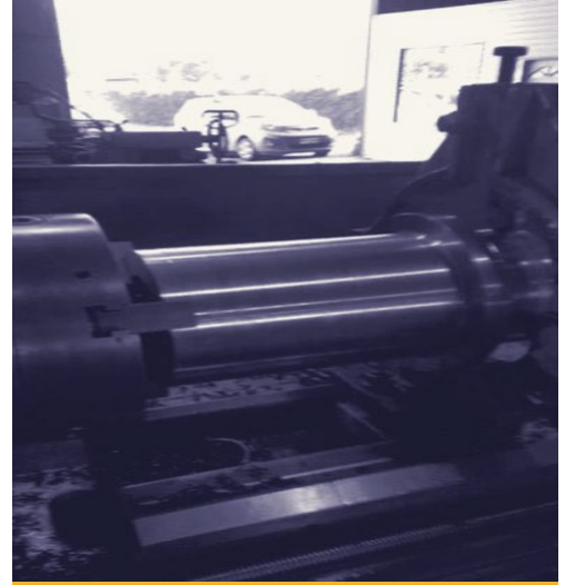
MECANIZADO EN TORNO