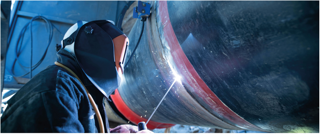
CALDERERÍA Y ESTRUCTURAS – SOLDADURA CERTIFICADA