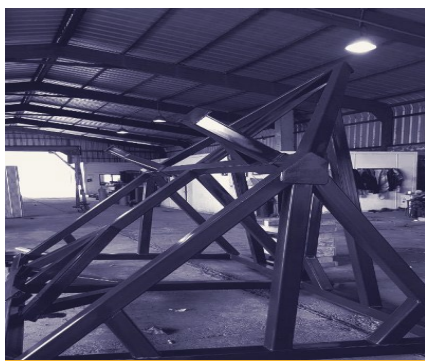
TRANSPORTE DE CORONA