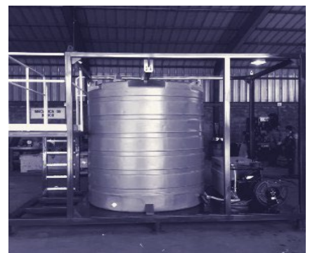
ESTANQUE CON HIDROLAVADORA